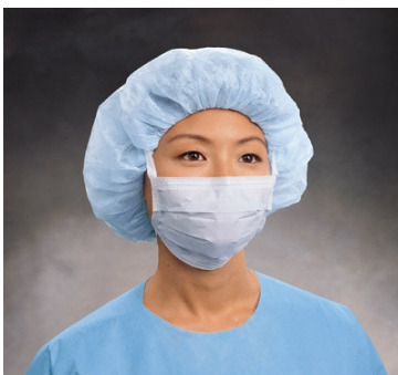
Photo d'un masque chirurgical. L'organisme Ontario Health and Safety Practitioners considère que ces masques ne constituent pas un équipement de protection respiratoire individuelle.

Les masques chirurgicaux portés par les personnes infectées jouent peut-être un rôle dans la prévention de la grippe, en réduisant la quantité de matière infectieuse qui est relâchée dans l'environnement. Lorsqu'on les porte pour éviter l'exposition aux agents pathogènes, les masques chirurgicaux fournissent un obstacle physique lors du contact avec des mains contaminées et sur la trajectoire des particules balistiques. Leur plus grande limitation est qu'ils ne forment pas un joint étanche sur le visage, de sorte que les particules inhalables peuvent malgré tout avoir accès aux voies respiratoires. De surcroît, l'efficacité des filtres des masques chirurgicaux pour ce qui est de bloquer la pénétration des particules d'échelle trachéobronchique ou alvéolaire est très variable et on ne sait pas quelle est leur efficacité pour ce qui est de bloquer les