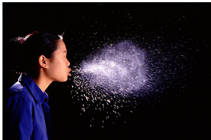
Nuage de particules créé quand la personne éternue (Davidhazy, 2007).

Le virus de la grippe sort des voies respiratoires d'une personne infectée par deux principaux canaux : soit (i) par expulsion du virus dans l'air lorsque la personne éternue, tousse, parle, respire ou dans le cadre de procédures médicales produisant des aérosols soit (ii) par transfert direct des sécrétions respiratoires à une autre personne ou surface. Le nouveau patient contracte le virus soit par inhalation des particules infectieuses dans l'air soit par contact direct avec des matières infectieuses ou par autoinoculation par l'intermédiaire d'une main contaminée.