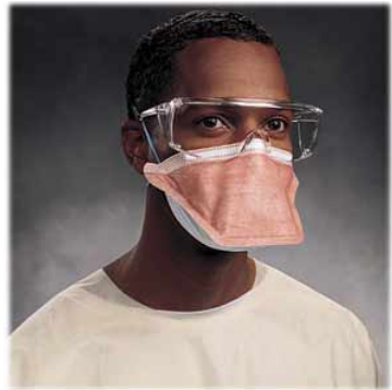
Photo d'un masque avec filtre à particules. L'efficacité de ces respirateurs dépend de l'efficacité du filtre et de l'étanchéité du joint.