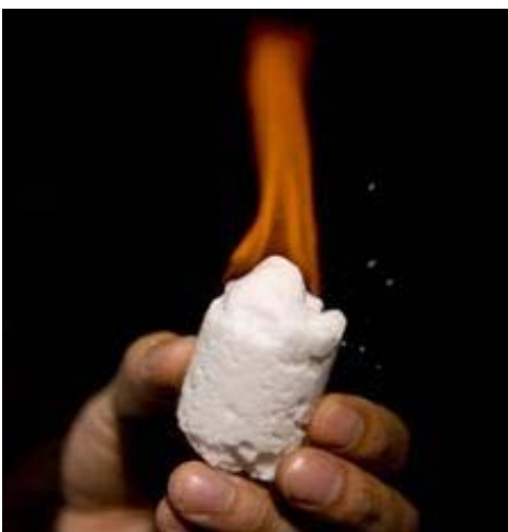
Figure 1 - Hydrate de gaz en combustion

Survol des hydrates de gaz – Le gaz contenu dans l'hydrate de gaz d'origine naturelle se forme lors de l'altération microbienne ou thermique de la matière organique sous les fonds marins ou sous le pergélisol, qui dégage du méthane et d'autres produits gazeux. (Le méthane est de loin le gaz le plus répandu dans les hydrates de