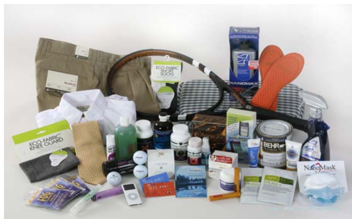
Quelques nanoproducts existants David Hawxhurst pour le Project on Emerging Nanotechnologies

Le comité s'est également penché sur les défis spécifiques liés à la gestion en matière de réglementation. Il est d'avis qu'une approche adaptative de l'évaluation et de la gestion des risques fondée sur la notion de cycle de vie est la plus appropriée. En raison du grand nombre de classes de nanomatériaux et de la nécessité d'évaluer au cas par cas les risques pour la santé et l'environnement, il faut une approche coordonnée entre les agences gouvernementales, entre les niveaux de gouvernement, ainsi qu'avec nos partenaires internationaux, afin d'éviter toute duplication d'efforts et la création de réglementations incompatibles. Un aspect crucial de la gestion des risques dans un contexte réglementaire est celui de la participation du public, c'est-à-dire non seulement des intervenants qui se manifestent spontanément, mais aussi des citoyens et consommateurs en général. Des mécanismes effectifs de participation du public à la formulation des politiques de réglementation concernant les nanomatériaux sont essentiels à l'établissement et au maintien de la confiance du public envers cette technologie.